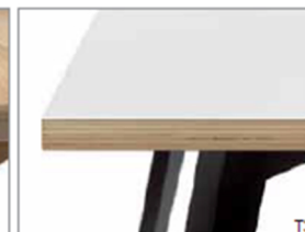
T3 Plateau et chant droits Recht blad en kant