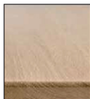
BOIS / HOUT