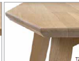
T2 Plateau et chant biseautés Schuin blad en kant