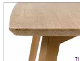
T1 Plateau et chant arrondés Afgerond blad en kant