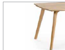
PB (H76 / H90 / H110)